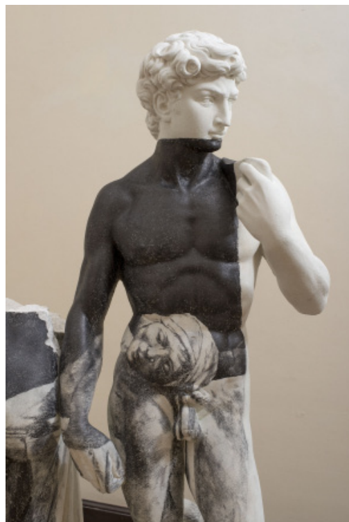
Dreamers IV , 2015, graphite sur statue en béton, détail © A. Mastrovito, photo : Giorgio Benni.

Site de l'artiste : http://www.andreamastrovito.com/