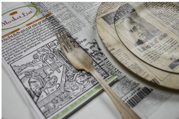
Dinner - Nous sommes tous Américains , 2015, crayon sur techniques mixtes © A. Mastrovito, photo : Maria Zanchi.

« N'importe où hors du monde » est un projet tripartite que l'on peut aussi découvrir aux châteaux de Suze-la-Rousse et de Grignan, propriétés du Département de la Drôme, avec des productions liées à l'identité de chaque lieu.