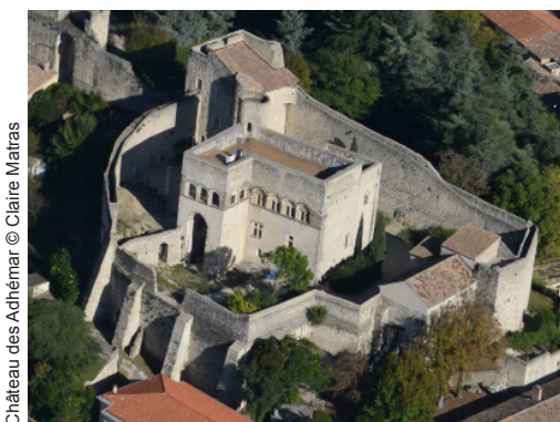
Château des Adhémar

Propriété du Département de la Drôme, le château des Adhémar à Montélimar est un monument historique classé qui accueille depuis 2000 un centre d'art contemporain. Cette structure de diffusion référente accompagne des projets d'artistes dans la singularité d'un propos liant ambition artistique et ancrage territorial. Elle s'inscrit dans le projet des trois châteaux départementaux (Montélimar, Grignan, Suze-la-Rousse) dont l'objectif est de croiser création contemporaine et patrimoine.