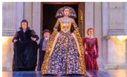
Pièces de théâtre